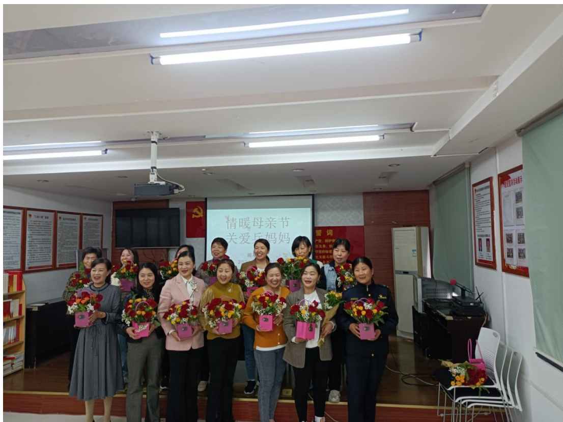
5月12日，贵池区秋浦街道湖心社区组织现役军人母亲参加“情暖母亲节，关爱兵妈妈”母亲节活动。