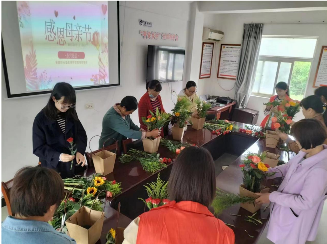
5月12日，贵池区江口街道永兴社区组织现役军人母亲参加插花活动。