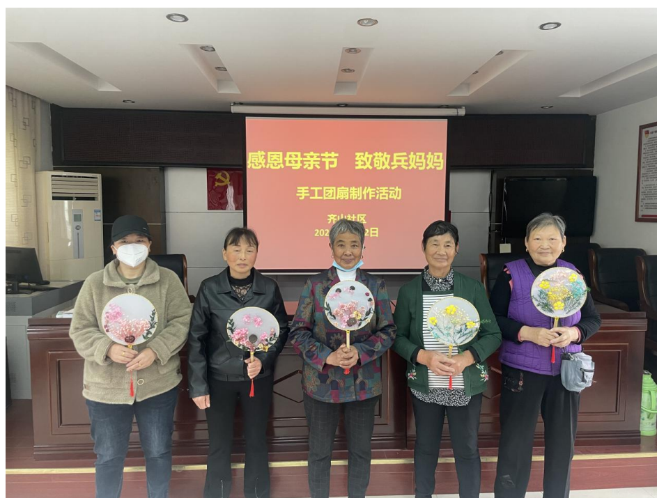
5月12日，贵池区清溪街道齐山社区邀请辖区5位现役军人母亲参加“感恩母亲节，致敬兵妈妈”手工团扇制作活动。