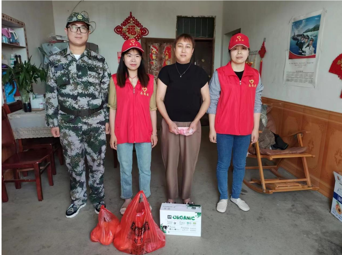
5月14日，贵池区牛头山镇木闸社区母亲节走访慰问现役军人家庭，并送上祝福和慰问金。