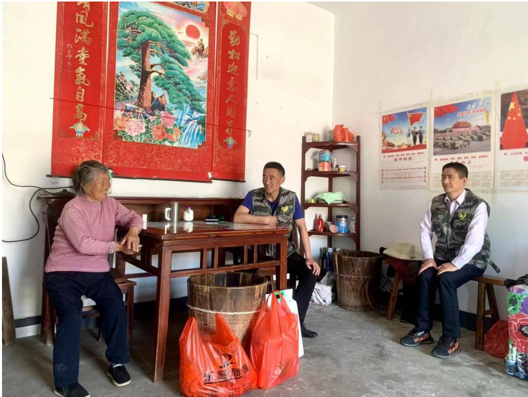
5月14日，石台县退役军人事务局有关负责同志看望慰问烈士母亲、边海防军人母亲，为她们送去大米水果等生活用品，祝福她们母亲节快乐，并开展红耀江淮志愿服务活动。